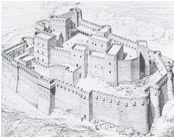
ภาพเขียนของปราสาทเซวาลีเยร์