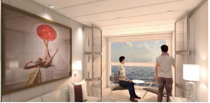
● ห้องพักแบบด้าโน (Interior)